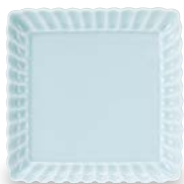
561 80 061 15.5cm正角皿 D-15.7 H-2.2 ¥1,700