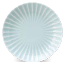
561 80 002 18cm丸皿 D-18.5 H-2.8 ¥1,000

■かすみ 青白 1合徳利 ■かすみ 青白 ぐい呑み ■かすみ 青白 21cm長角皿