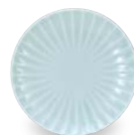
561 80 006 12.5cm丸皿 D-12.6 H-2 ¥550