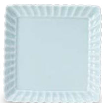
561 80 060 17cm正角皿 D-17.5 H-2.6 ¥2,000