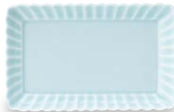
561 80 071 21cm長角皿 L-21.1 S-13.3 H-2.8 ¥2,000