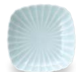
561 80 069 12cm丸角皿 D-12 H-2.5 ¥1,000 松花堂 3,4,6,11仕切り対応