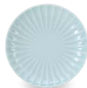
561 80 005 14.5cm丸皿 D-14.5 H-2.3 ¥850