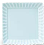
561 80 062 13.5cm正角皿 D-13.5 H-2 ¥1,300