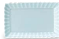
561 80 073 17cm長角皿 L-16.8 S-10.8 H-2.2 ¥1,700