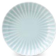
561 80 004 16.5cm丸皿 D-16.5 H-2.5 ¥900